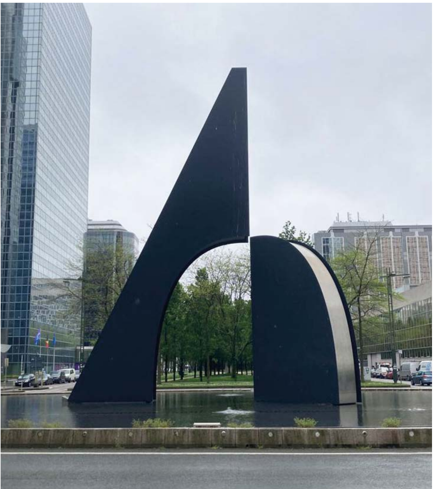
Tapta, Esprit ouvert , 1997, staal & roestvrij staal, 1700 × 1200 × 500 cm, vlakbij Noordstation Brussel. © In opdracht van Proximus (vroeger Belgacom) en WTC nv; beheerd door het Brussels Hoofdstedelijk Gewest.

Tapta sterft – plots – in 1997 in Brussel, net wanneer haar moederland Polen haar werk ontdekt in een grote solotentoonstelling in de Zachęta National Gallery of Art in Warschau, en haar monumentale sculptuur Esprit Ouvert (1997) vlakbij het Brusselse Noordstation wordt ingewijd.