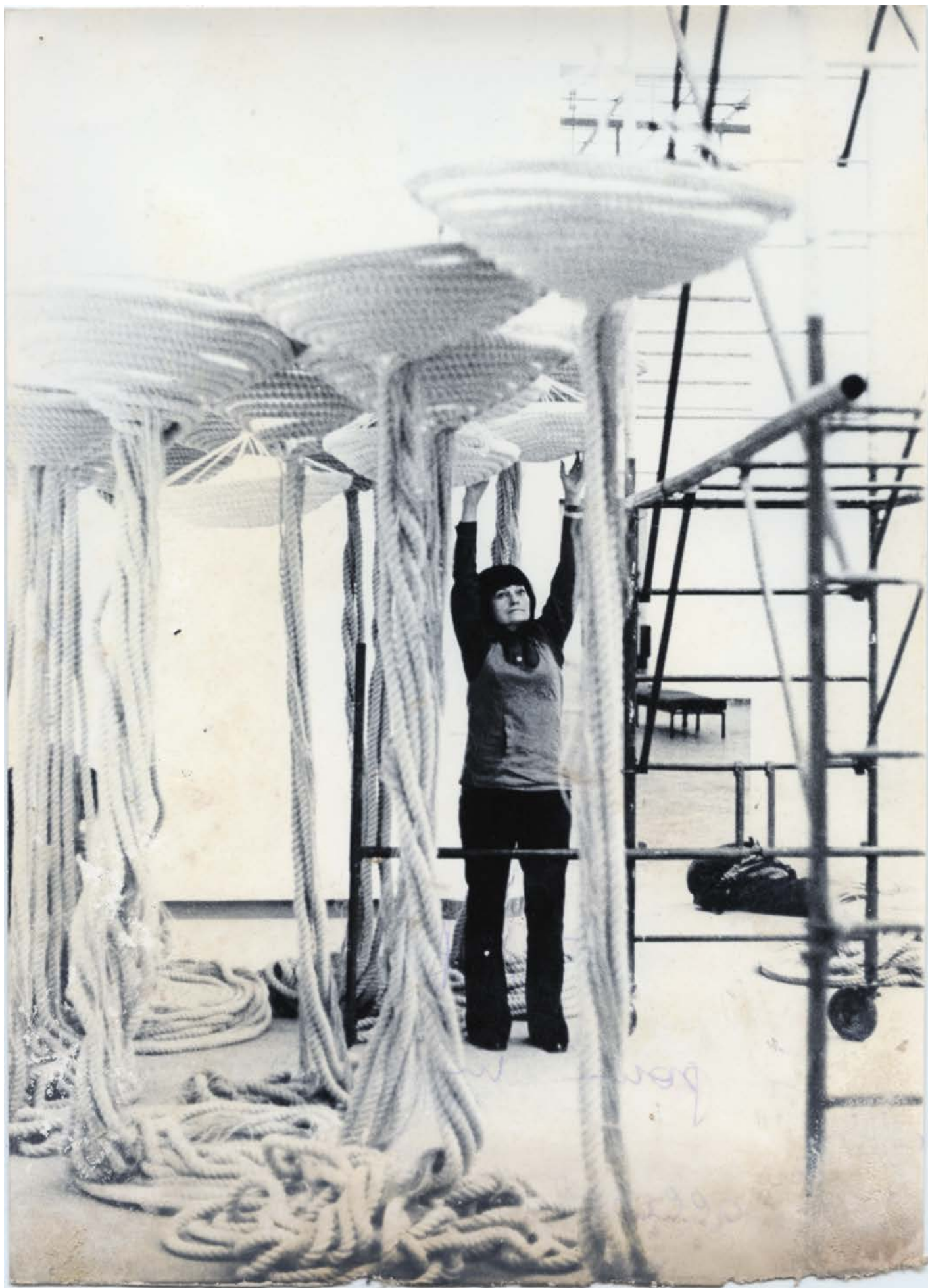
Tapta tijdens de installatie van Formes pour un espace souple (1974) in het Paleis voor Schone Kunsten (nu Bozar) in Brussel, 1975, zwart-wit foto

dezelfde materialen en technieken, maken textielkunstenaars en -studenten van La Cambre en LUCA School of Arts zo ook de procesgebonden en collectieve ervaring die Tapta nastreefde opnieuw tastbaar.